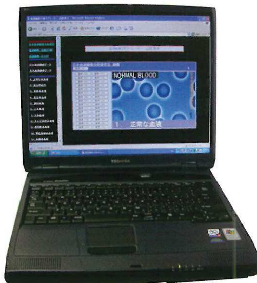
血液画像データ (パソコンはオプション)