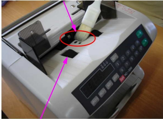
キッカーローラー

1. 付属の掃けブラシで機械上面を清掃して下さい。特にホッパーセンサー部とキッカーローラーを入念に清掃して下さい。